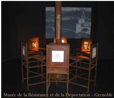
Musée de la Résistance et de la Déportation - Grenoble